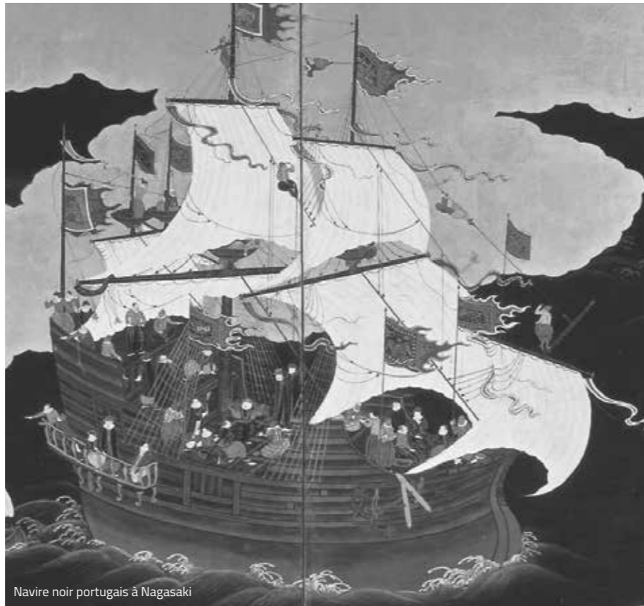
Navire noir portugais à Nagasaki

Une préparation minutieuse et une présentation soignée sont des éléments fondamentaux de la cuisine japonaise. La gastronomie est un art et même les plats les plus simples sont souvent préparés par des chefs qui ont suivi un apprentissage de plusieurs années.