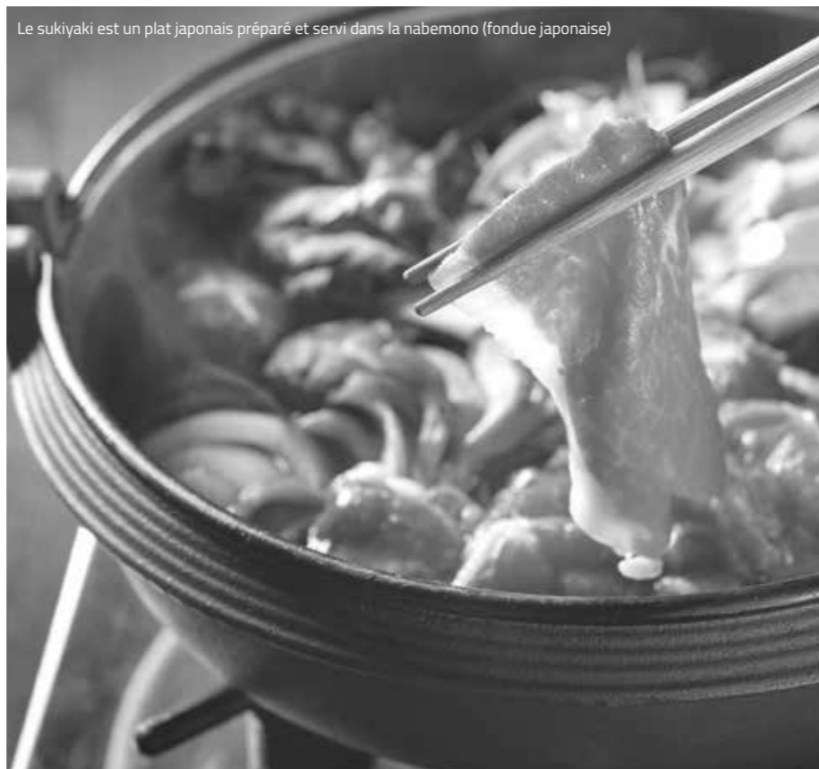
Le sukuyaki est un plat japonais préparé et servi dans la nabemono (fondue japonaise)

Le visage blanc si particulier, les lèvres rouges et la coiffure richement décorée de la Geisha constituent une image profondément ancrée et dépeinte dans le monde entier comme l'entrée d'un monde où la plupart d'entre nous, pauvres mortels, ne sommes pas invités